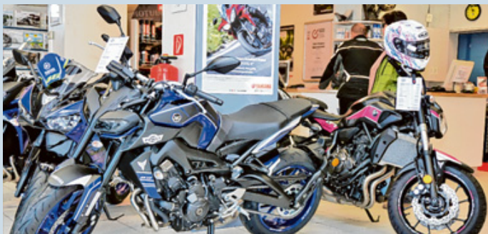
Bikes für Groß und Klein bietet Finkl's Erlebnis Motorrad.

In Finkls umfangreichem Lager schlummern insgesamt etwa 300 gebrauchte und neue Motorräder, die für eine Probefahrt bereitstehen. Auch auf Gebrauchtfahrzeuge gibt es Garantie. Zudem können viele Modelle gemietet werden. sgr