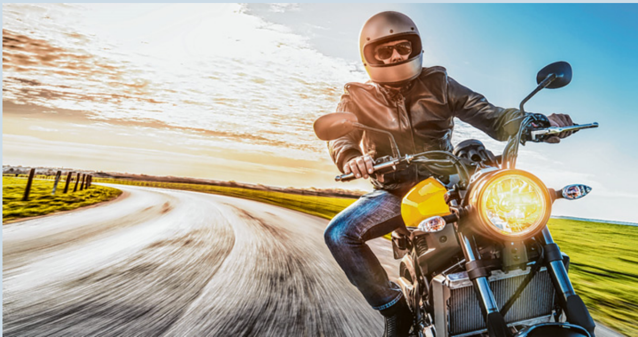
Lebensfreude, Adrenalin und Freiheit – all das bedeutet der Ritt auf dem Motorrad für leidenschaftliche Biker.